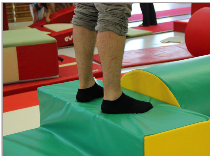
FIRMEZA DE LA ESPUMA