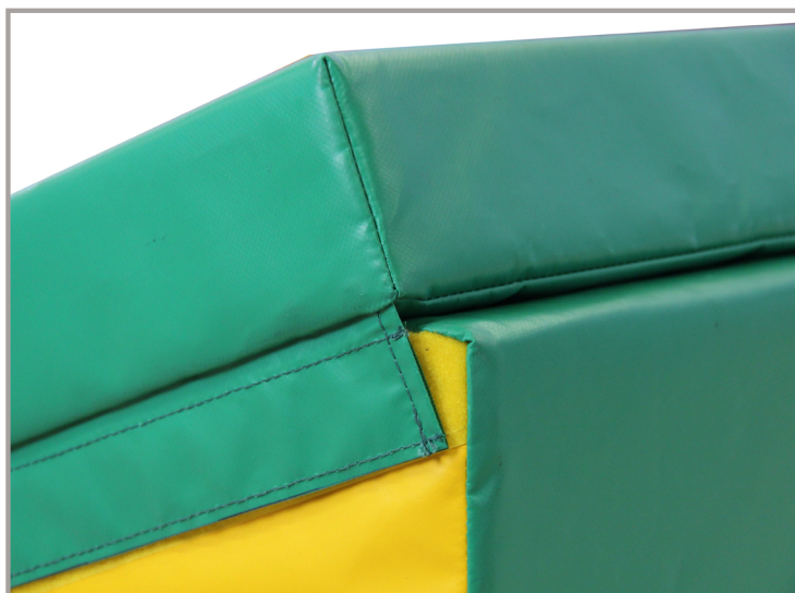
TIRA DE COHESIÓN

Todos los productos de la gama Handi-Gym responden a las necesidades y expectativas de las personas discapacitadas.