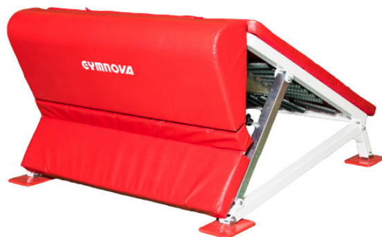
Protection arrière Réf. 5068 en option