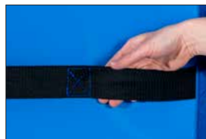
Asas o correas de transporte

FUERZA EQUILIBRIO AUTOCONFIANZA SALUD BIENESTAR CREATIVIDAD TRABAJO EN EQUIPO