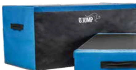
Ref. 930 BLOQUES