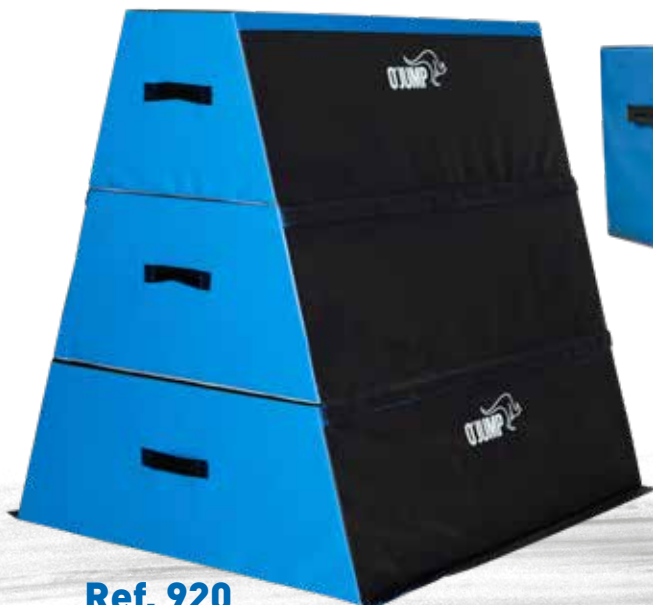
Ref. 920 TRAPEZIUM