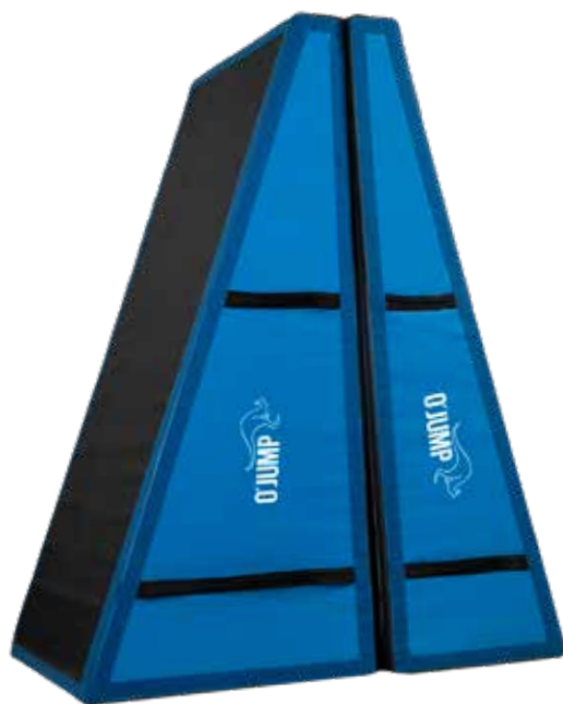
Ref. 910 PLANOS INCLINADOS