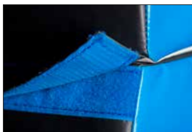
La unión de las planchas se realiza mediante bandas de velcro.