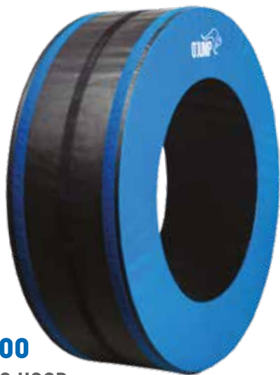
Ref. 900 TRICKING HOOP

El kit está compuesto por las siguientes referencias: