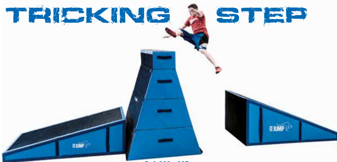
Ref. 920 y 925