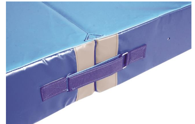
Sangles de maintien